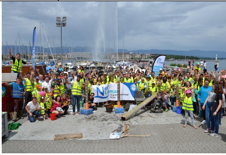
A Genève les Eaux-Vives