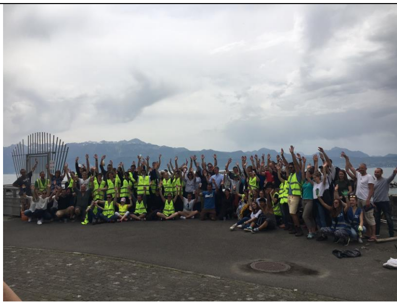
A Lausanne Ouchy